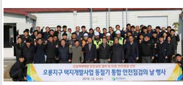
협력업체 인권경영 간담회